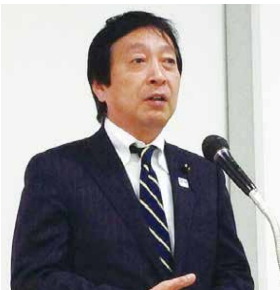
地域の会合で消防力強化と広域化について県政報告

「千葉県消防広域化推進計画」を再策定した。各市町村の将来的な人口減少を見据え、住民の安心安全を守っていくためには、さらに踏み込んで消防広域化を実現することがどうし