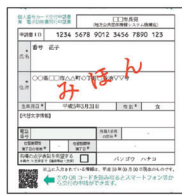
交付申請書のQRコード