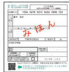
交付申請書の申請書ID