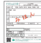
交付申請書のQRコード