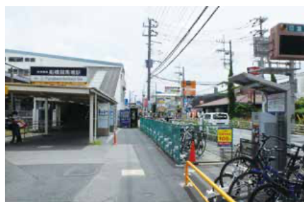
船橋競馬場駅前から国道14号をまたぐ横断歩道橋の建設が計画されている