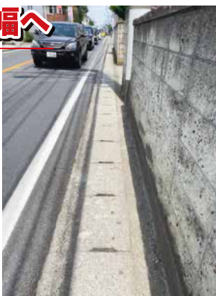
歩道が狭隘な前原駅付近の道路

では、被接種者に対し、接種後に現れる可能性のある症状などの注意点をまとめた厚生労働省のリーフレットを配付しています。これに加え、痛みや腫れなどの軽い症状は頻繁に現れやすいことなど、被接種者が不安に思う点に対し、わかりやすく記載したリーフレットを作成するなどして、周知に努めています。